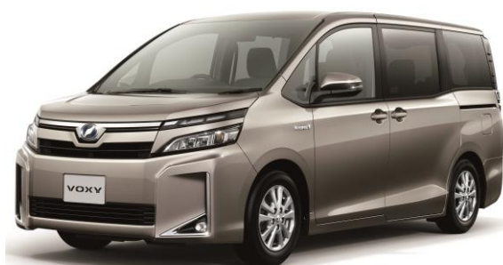
▲飛沫循環抑制車両(外観)

※運転席・助手席のある前方スペースと、後部座席以降の後方スペースの間に隔壁を設置。後方スペースを陰圧にすることで、後方の空気が前方に循環しないようにコントロールした車両。